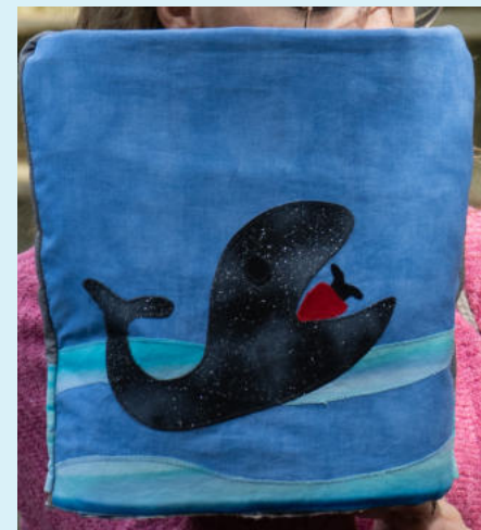
Jona steckt im Wal