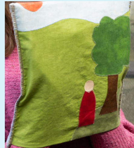
Jona gemütlich zuhause

Gott freut sich, dass Jona seinen Auftrag so gut erfüllt hat. Er vernichtet Ninive nicht, sondern vergibt den Menschen, die dort leben und es gibt einen