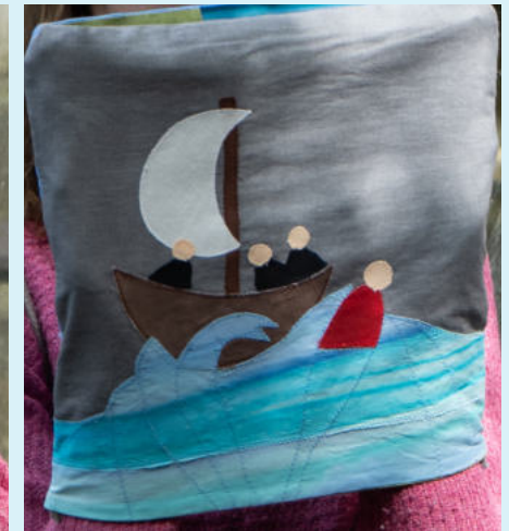
Jona fällt im Sturm aus dem Boot