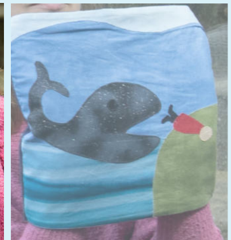
Jona wurde aus dem Wal ausgespuckt

Neuanfang. Jona sitzt im Schatten, er ärgert sich. Er sagt: „Gott muss die Stadt zerstören, die Menschen waren böse!“ Die Sonne brennt heiß. Die Blätter verdorren. Jona ist nicht mehr im Schatten. Er