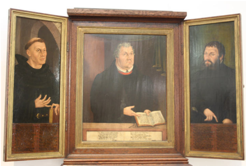
Triptychon: Luther-Schrein • Luther als Mönch, Professor und als Junker Jörg

Postkarte: Wer bin ich - der ibg (Internationale Bonhoeffer-Gesellschaft) zu finden unter: https://www.dietrich-bonhoeffer.net/downloads/